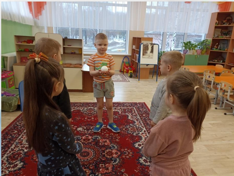
Игра «Ты катись, катись снежок».