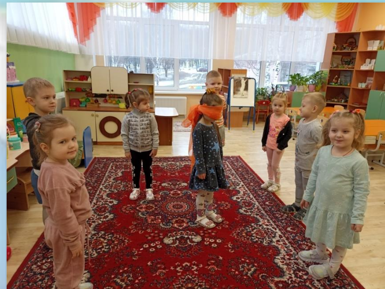
Игра «Золотые ворота»