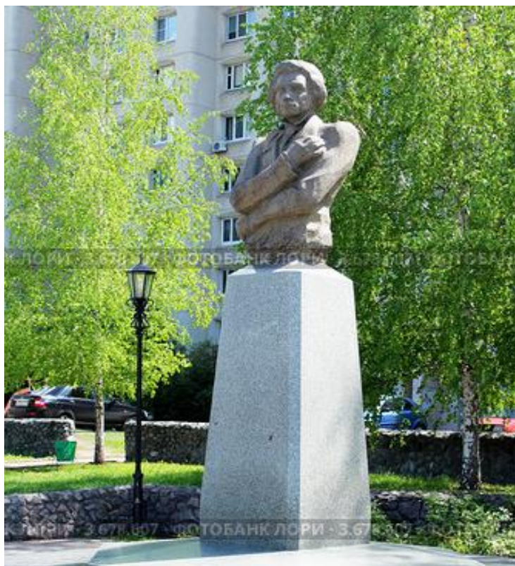
2.«Памятник А.С. Пушкину» (микрорайон Королева) [https://www.kavicom.ru/pages/view]