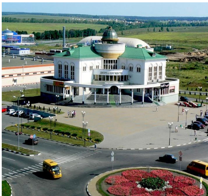
1. "Дворец торжеств" (микрорайон Надежда) [http://www.skyscrapercity.com/showthread.php]