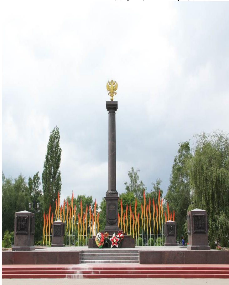
5. Стела "Старый Оскол - город воинской славы" [ http://voskole.ru/post/Gorod-Staryj-Oskol ]

За мужество, стойкость и массовый героизм, проявленные защитниками города в борьбе за свободу и независимость Отечества, Указом Президента Российской Федерации от 5 мая 2011 года №588 городу Старый Оскол присвоено почётное звание Российской Федерации "Город воинской славы".