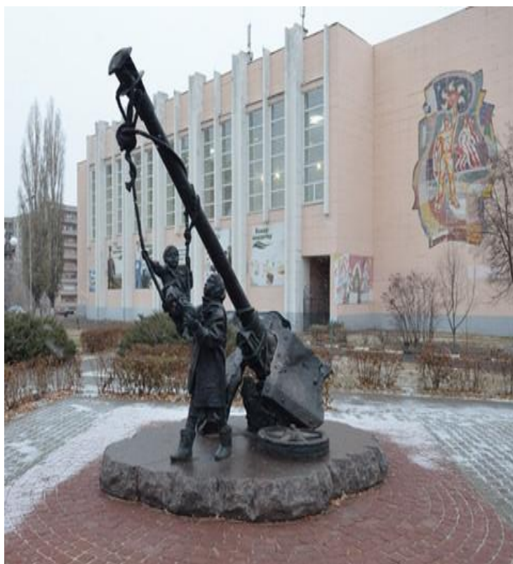
Памятник «Детям войны» (микрорайон Макаренко) [ http://zoozel.ru/gallery/staryi-oskol-voina ]

Памятник из бронзы представлен в виде качелей, которые привязаны к дулу искореженной пушки. На качелях сидит маленький мальчик, а рядом с ним находится его старшая сестра, в не по размеру большой и ветхой одежде. Памятник посвящен детям, жившим в непростые годы Великой Отечественной войны.