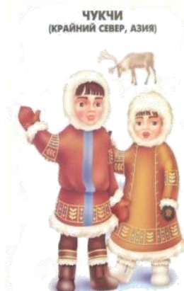
ЧУКЧИ (КРАЙНИЙ СЕВЕР, АЗИЯ)