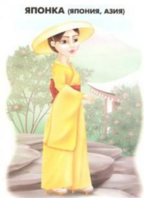
ЯПОНКА (ЯПОНИЯ, АЗИЯ)