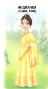
ИНДИАНКА (ИНДИЯ, АЗИЯ)