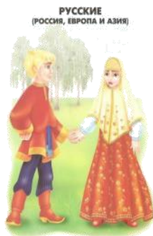
РУССКИЕ (РОССИЯ, ЕВРОПА И АЗИЯ)