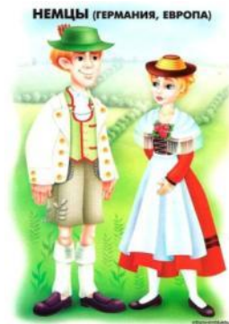
НЕМЦЫ (ГЕРМАНИЯ, ЕВРОПА)