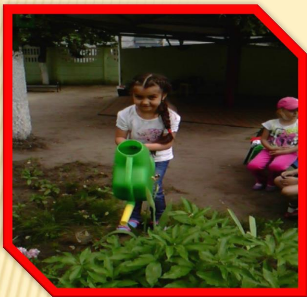
НА ЦВЕТОЧНОЙ КЛУМБЕ