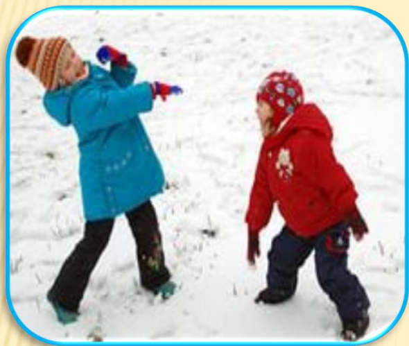
ИГРА В СНЕЖКИ