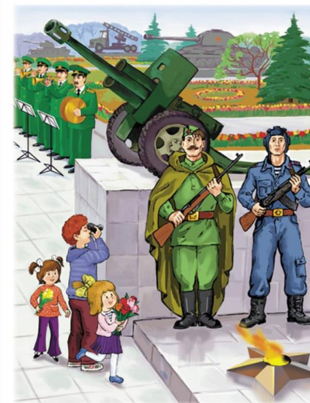
День защитника Отечества