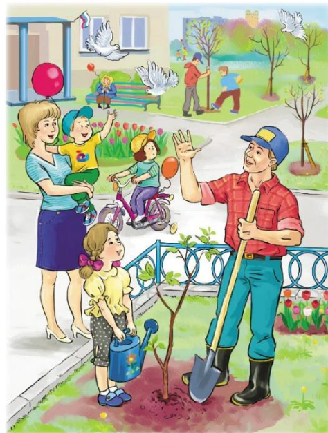
День весны и труда